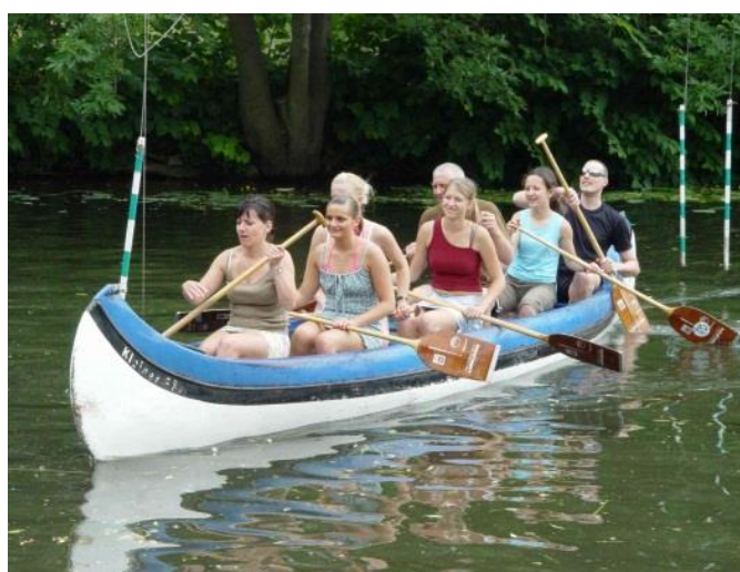
Kanufahrt auf der Oker mit den Gästen