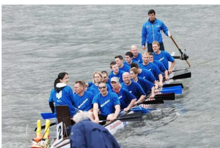
Drahenbootrennen: Das Boot