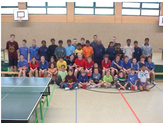
Treffen in der Sporthalle Klint

Die Tischtennisabteilung des RSV Braunschweig spielte mit je einer Mädchen- und Jungenmannschaft gegen Jugend- und Junioren-Nationalspieler aus Sri Lanka. In den Spielen zeigten sich die Gäste überlegen. Die RSV-Jungen unterlagen knapp mit 8:10. Die RSV-Mädchen unterlagen mit 3:15. Die von der A.G.S.E.P. (ASIAN GERMAN SPORTS EXCHANGE PROGRAMME) vermittelten Mannschaften reisten am Do. mit insgesamt 16 Vertretern an. Dieses waren außer den 12 Sportlerinnen und Sportler noch der Generalsekretär des Tischtennisverbandes von Sri Lanka und weitere 3 Erwachsene Begleitpersonen. Alle Gäste wurden privat untergebracht. Das Programm begann am Donnerstag mit der Anreise und dem Treffen in der Sporthalle Klint. Der Freitag stand den Gästen mit ihren Gastgebern zur freien Verfügung. Am Sonnabend war vormittags ein gemeinsames Training in der Sporthalle Klint. Nachmittags wurden die Gäste von Vertretern der Stadt Braunschweig begrüßt. Nach dem Vergleichskampf am So. gab es ein gemeinsames Essen im Kanuheim des RSV am Werkstättenweg.