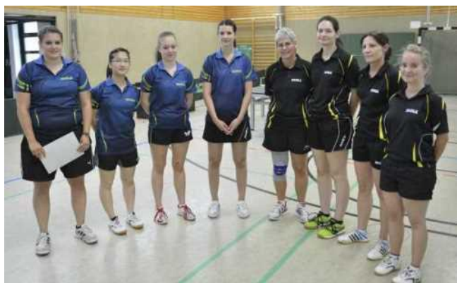
31.08.2013: 1. und 2. Frauen