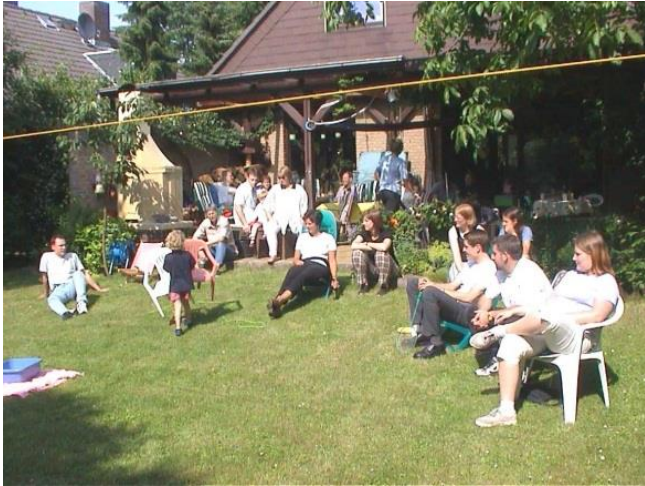
Radrallye mit Abschluss in Walters Garten