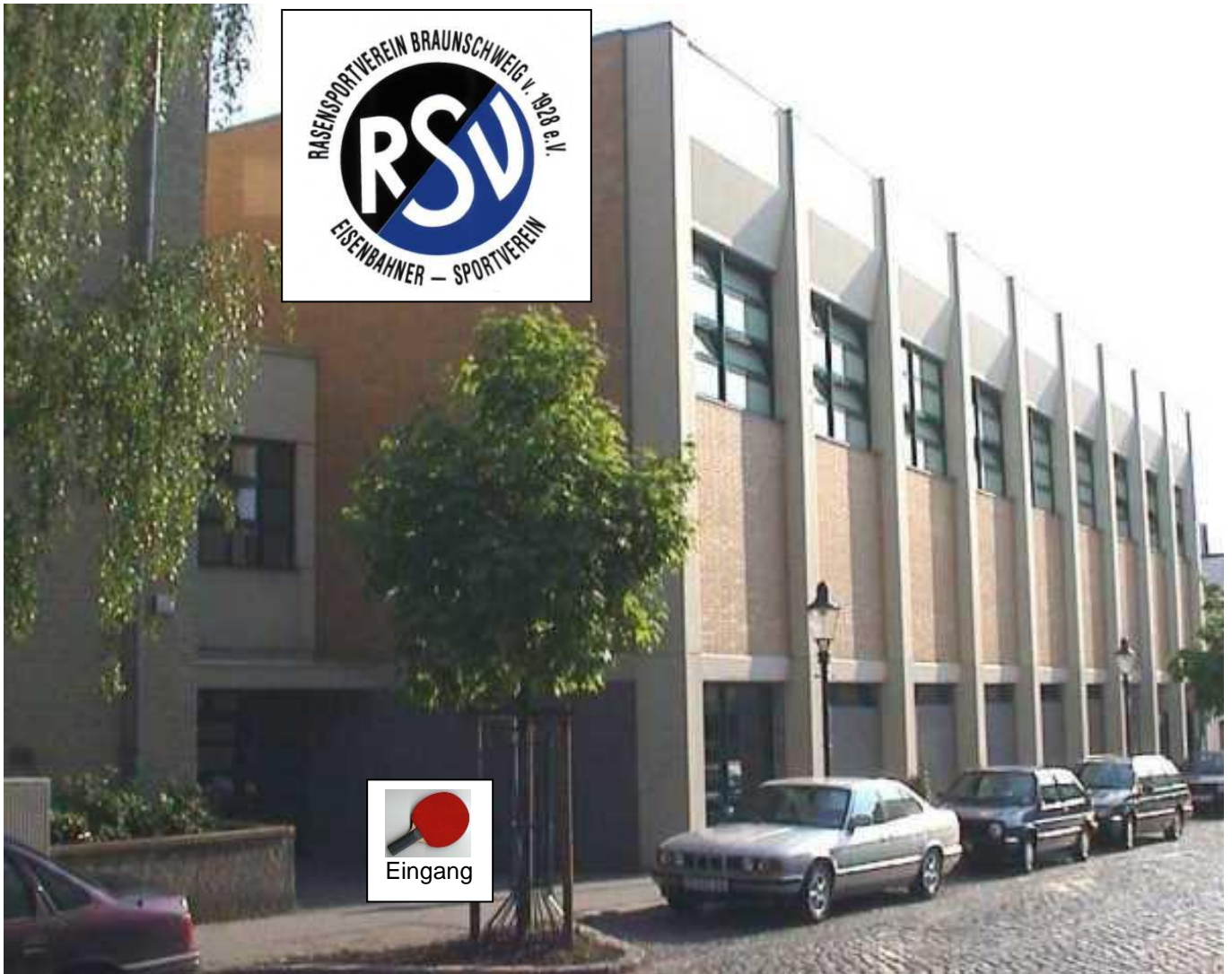
Sporthalle Grundschule Klint, Klint 26 / Ecke Ritterstr, 38100 Braunschweig / Magniviertel,