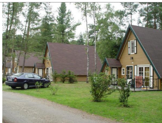
Die Unterkunft im Ferienpark Molenheide

Nachdem wir am 13.05.16 um 12.00 Uhr in Braunschweig starteten, kamen wir nach einigen Pausen und unfreiwilligen Staus um 19.30 Uhr in unserer Unterkunft, dem Ferienpark Molenheide, an. Der Ferienpark liegt zwar ca. 20 km von den Spielhallen in Hasselt entfernt, bietet aber nach dem Tischtennis mit Schwimmbad, Spiellandschaften, Restaurants und Parkgelände weitere gute Betätigungsmöglichkeiten. Unterkunft waren zwei komplett eingerichtete Sechser- und ein Fünfer-Bungalow, die den höchsten Kostenbeitrag verursachten. Die Verpflegung wurde zum Teil