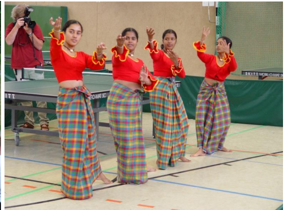
Mädchen aus Sri Lanka bei einem Volkstanz