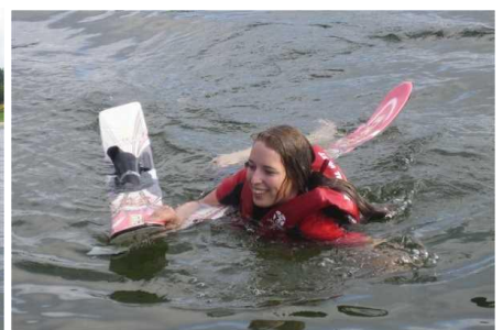
verbunden mit schwimmen