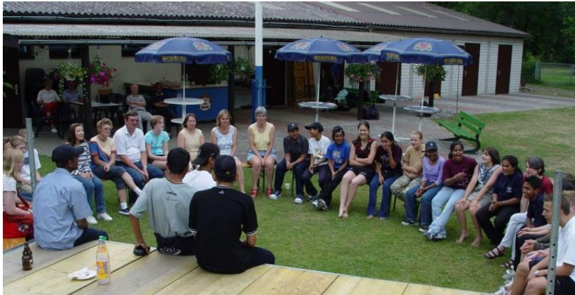
Feiern am Bootshaus der Kanuabteilung

Im Jahr des 75-jährigen Bestehens des RSV Braunschweig hatte die TT- Abteilung zum 2. Mal eine Mädchen- und Jungenmannschaft aus Sri Lanka Gast. Die RSV-Mädchen siegten mit 10:1. Die RSV-Jungen unterlagen knapp mit 8:10. Die wieder von der A.G.S.E.P. (ASIAN GERMAN SPORTS EXCHANGE PROGRAMME) vermittelte Mannschaft reiste mit 12 Sportlerinnen und 4 Begleitpersonen am Donnerstag an und reisten am Dienstag wieder ab.