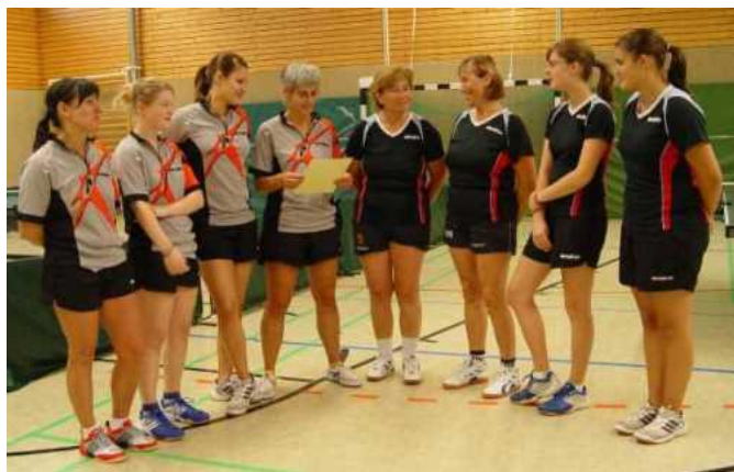
14.09.2006: 1. und 2. Frauen