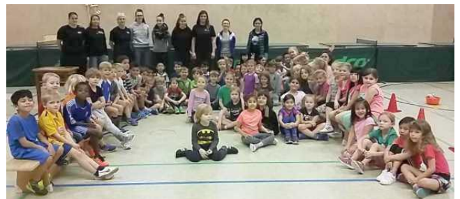
24.11.2017: 72 Kinder und 9 Betreuer