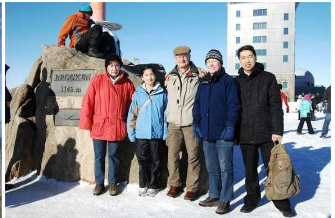
Auf dem Brocken im Winter