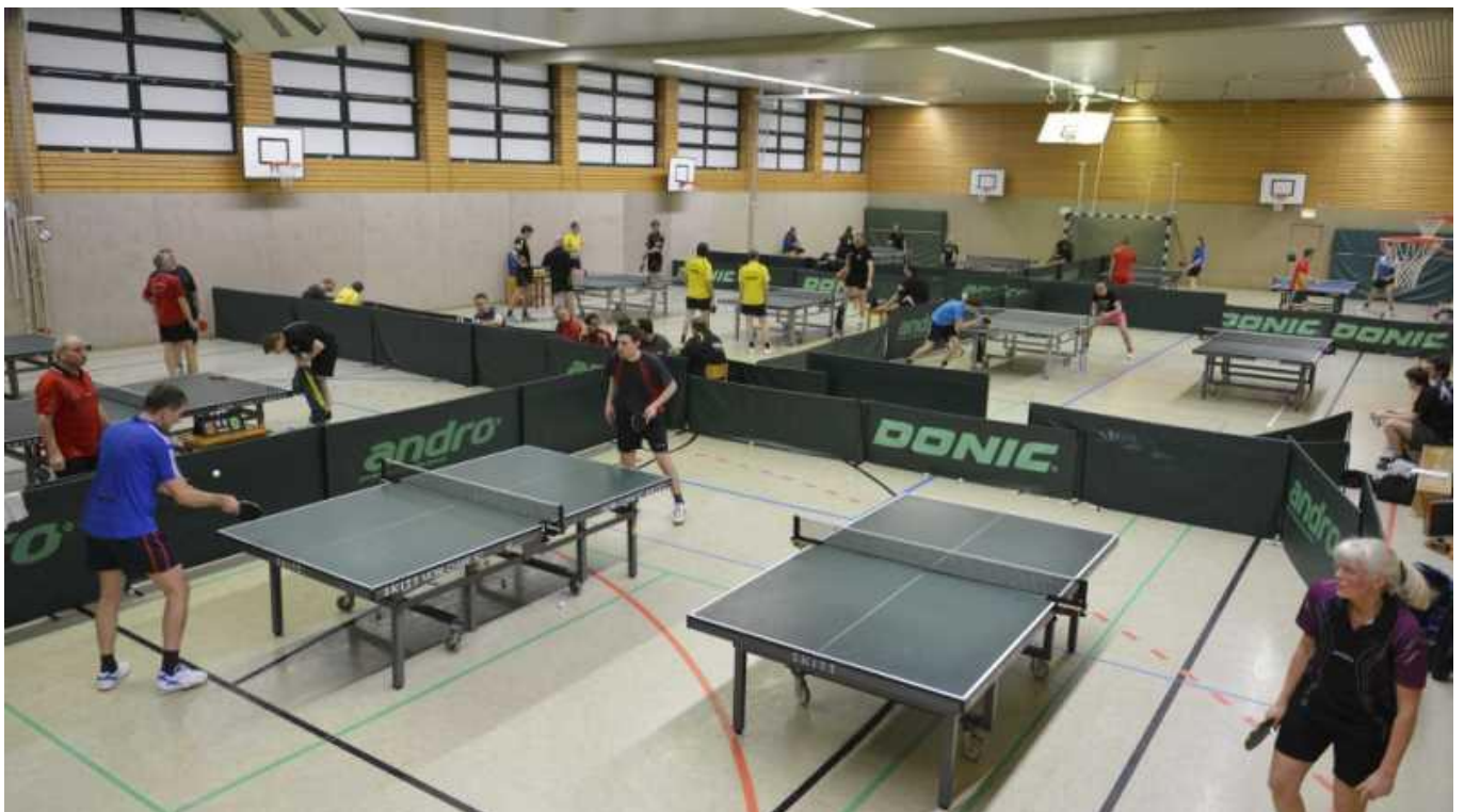
Jugendtraining: Mo. + Do. 17.00 Uhr–19.00 Uhr,