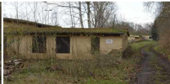
Sporthallen-Eingang am 08.12.2017, bereits 19 Jahre ohne TT-Spielbetrieb