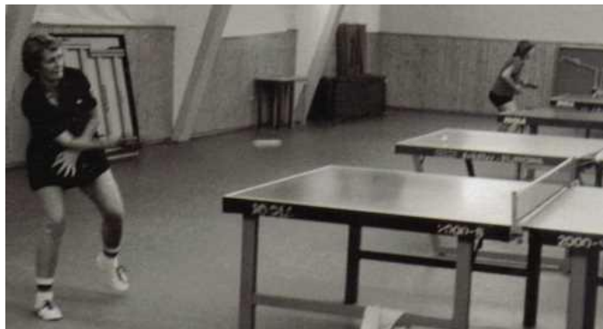
Die Sporthalle Ackerstraße 1986 von innen.

Zum 40-jährigen Jubiläum des RSV im Jahre 1968 wurde die Sporthalle innen und außen mit neuen Anstrichen versehen. Auch diese Arbeiten konnten noch von RSV-Mitgliedern in 80 freiwilligen Arbeitsstunden geleistet werden.