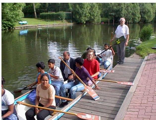
Anleger Bootshaus der Kanuabteilung