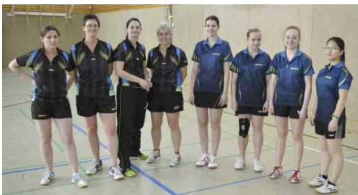
11.01.2014: 1. und 2. Frauen