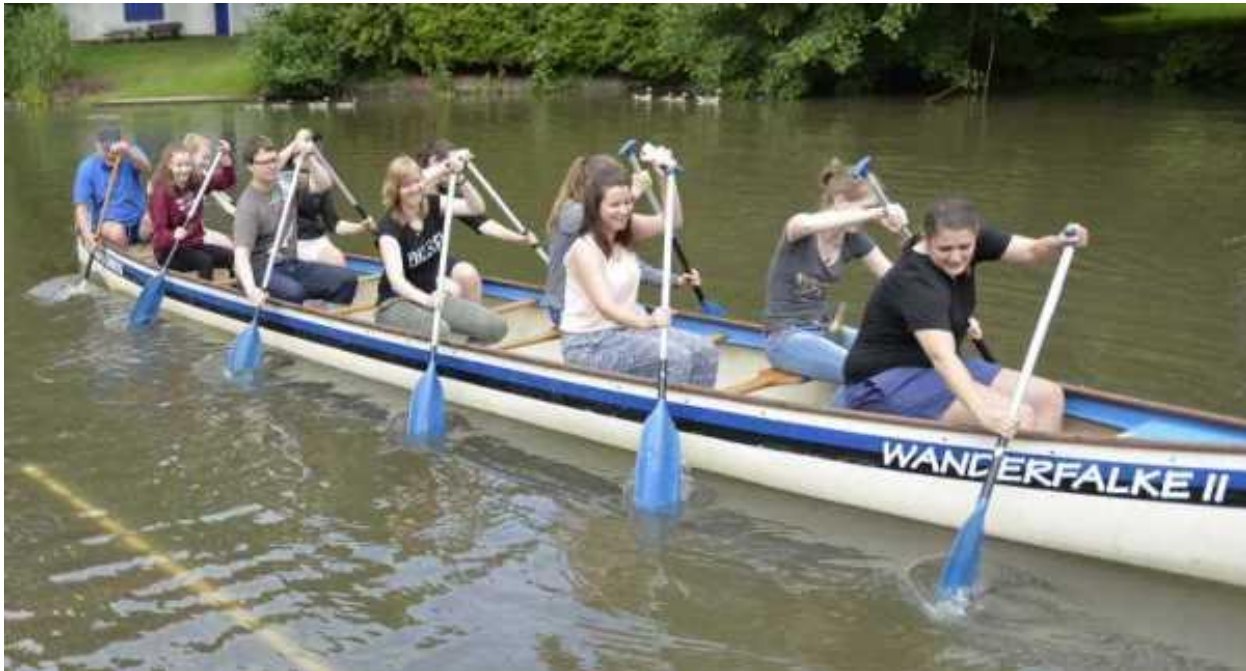
Zehnerboot mit Steuermann