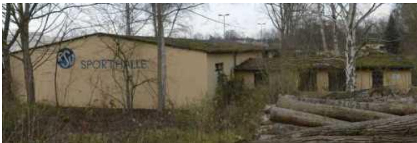
und am 08.12.2017, bereits 19 Jahre ohne TT-Spielbetrieb