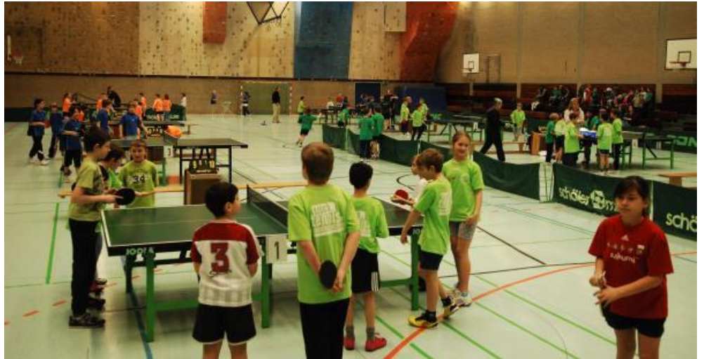
Die Sporthalle der TU Braunschweig mit den Aktiven

Das war ein Spaß für 70 Kinder, die am Tischtennis-Rundlauf-Cup Braunschweiger Schulen teilnahmen und die Stadtmeisterschaften ausspielten. Die vom Tischtennis-Verband Niedersachsen initiierte Wettkampfreihe fand nach Osnabrück und Lingen am Do., den 17.03.2011 von 8.00–13.00 Uhr in Braunschweig statt. Der Verband hatte Braunschweiger Grundschulen angeschrieben und die weitere Organisation dem Tischtennis-Stadtverband Braunschweig übertragen, der mit zahlreichen Helfern aus Vereinen den Ablauf organisierte.