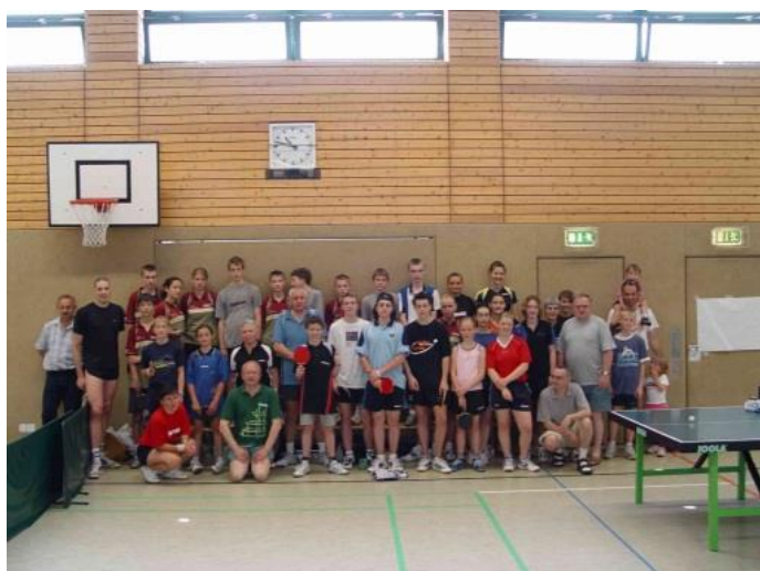
Sporthalle Klint mit RSVer und den Gästen aus Zawatzkie