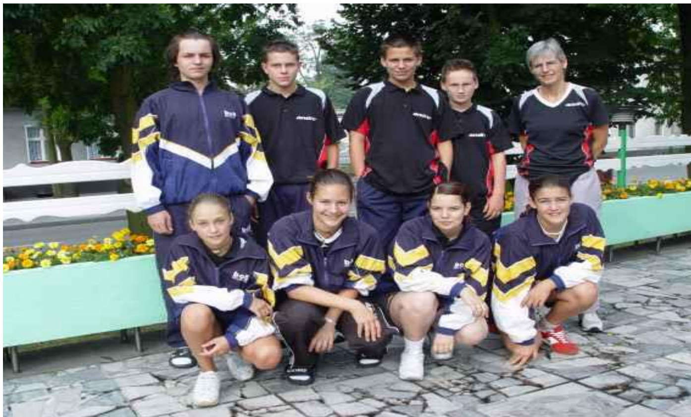
Das RSV-Team in Zawatzkie