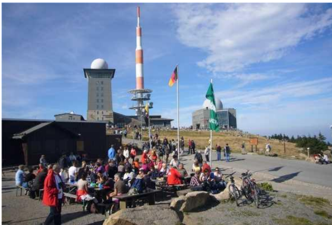
Auf dem Brocken im Sommer mit Picknik