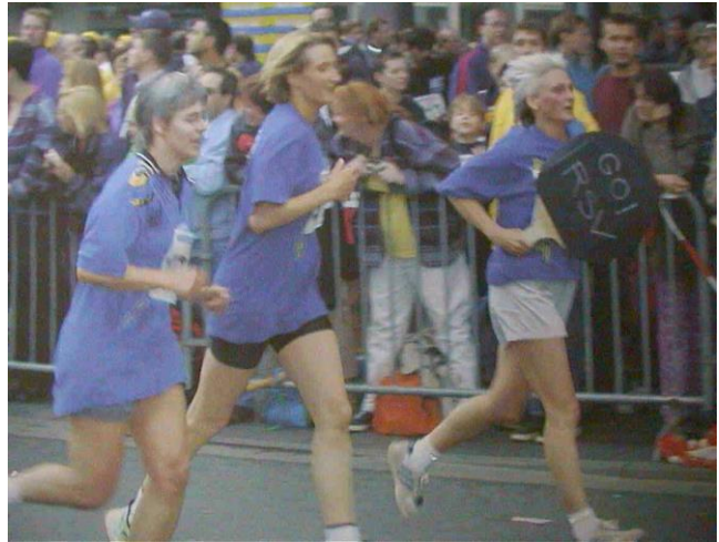
Teilnahme am Nachlauf des MTV Braunschweig