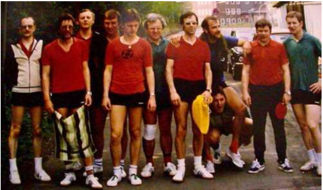
Das Training in der Halle Ackerstraße wurde oft mit Geselligkeit im Eingangsbereich verbunden – Bilder ca. 1986.