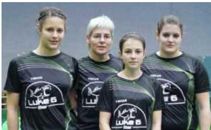
121207: 1. Frauen