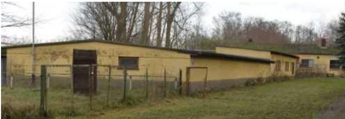
Blick von der Sporthalle zur RSV-Kegelbahn und der RSV-Gaststätte am 08.12.2017 (überall kein Betrieb mehr)